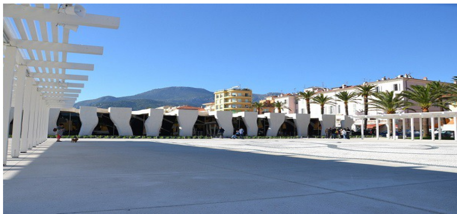
Musée Jean Cocteau