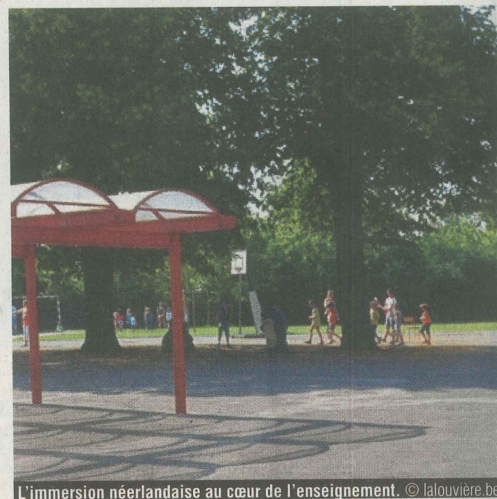
L'immersion néerlandaise au cœur de l'enseignement.